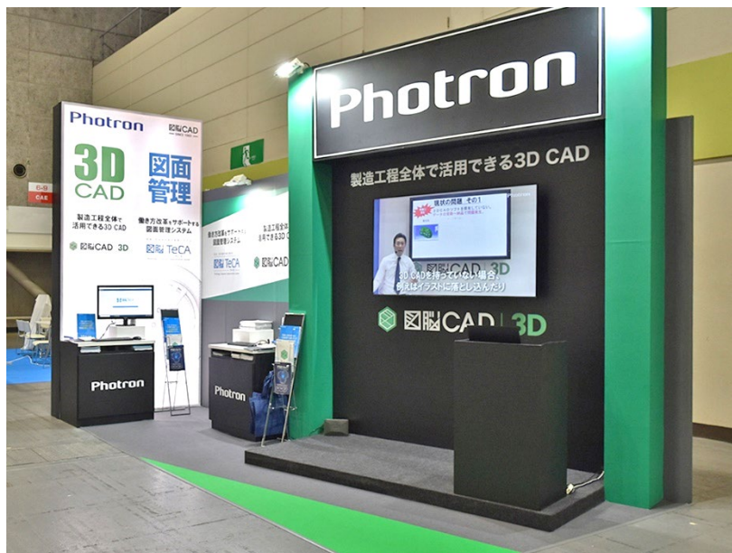
出展イメージ 【幕張メッセ 9ホール 53-30】