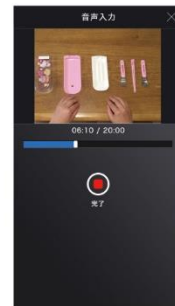
ナレーション・ BGMを追加