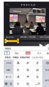
テキスト・ ロゴを配置