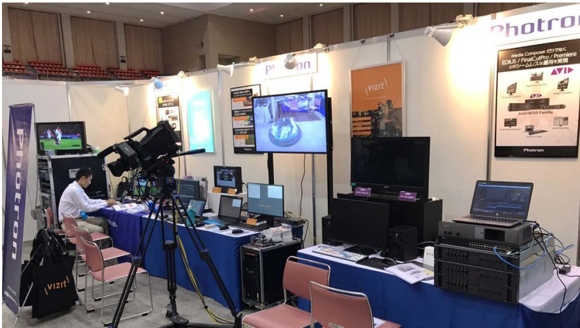
昨年の九州放送機器展 フォトロンブース