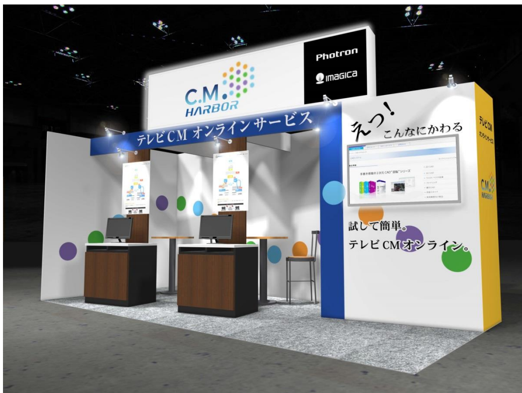
フォトロン/IMAGICA ブースイメージ

国内の映像業界インフラ/放送局向けシステムの開発・導入で長年の実績を誇るフォトロンと、経験豊富なIMAGICA専門スタッフによるトータル運用コーディネートで、テレビCM制作に関わるすべてのお客様へ、「簡単」かつ「安心・安全」にご利用いただける「C.M.HARBOR」で最新のテレビCMオンライン運用サービスをご提案いたします。【ブース番号:西ホール2階 W26-63】