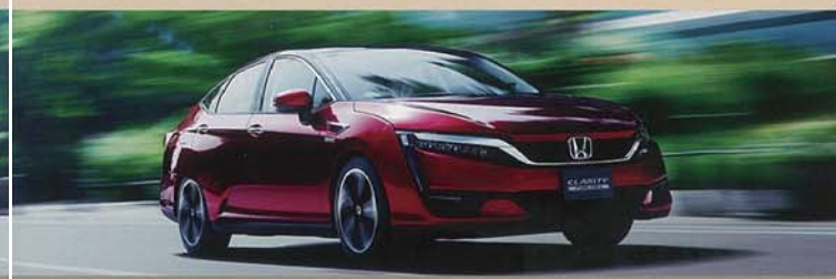
ホンダ クラリティ フューエル セル

燃料のサンプル、実車(トヨタi-unit、ホンダ クラリティ フューエル セルほか)、 模型などでのりものの燃料をくわしく紹介します。